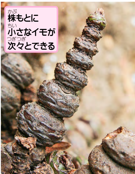
株もとに 小さなイモが 次々とできる