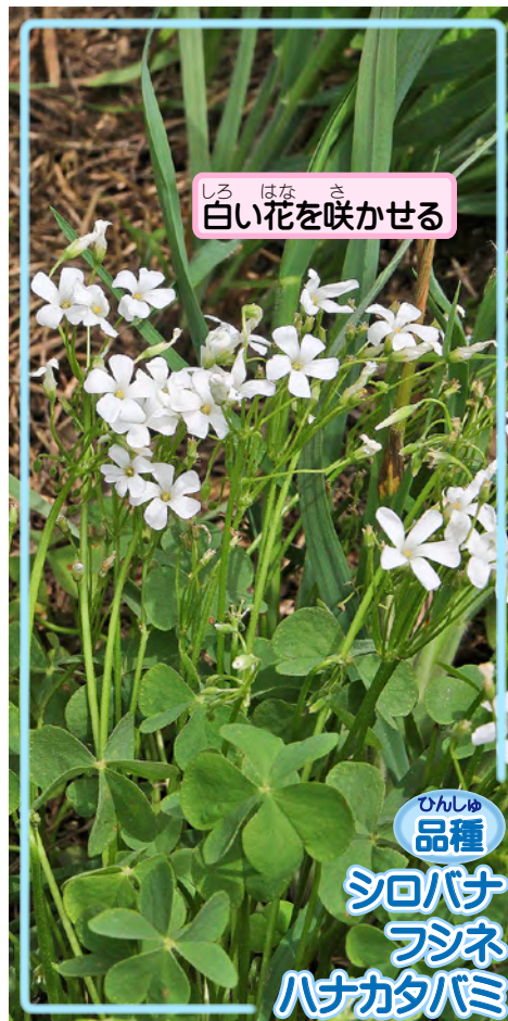
白い花を咲かせる