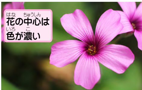
花の中心は 色が濃い

同じ仲間のムラサキカタバミに似 ているけど、花の中心の色で見分 けられるよ。イモカタバミが濃い 赤紫色なのに対し、ムラサキカタ バミはうすい黄緑色なんだ。