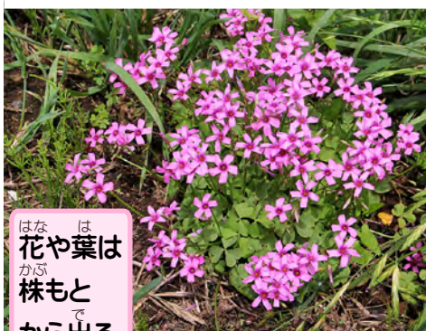
花や葉は 株もと から出る