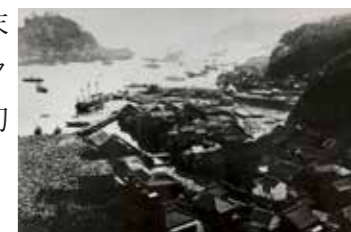
明治時代の浦賀ドック(浦賀船渠)

横須賀製鉄所には、国内最高水準の学校「巒舎(こうしゃ)」が設置され、その「演習図面」や出身者の一部、卒業生提案の「フランス料理フルコース案」を紹介します。横須賀製鉄所の同窓生たちは、浦賀ドック(浦賀船渠)の設立にも貢献しました。昨年末に寄贈を受けた「浦賀ドック貴重写真」も速報展として初めて当館で展示します。