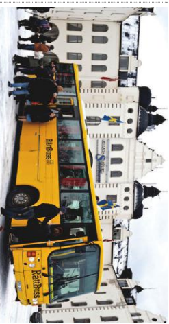
På väg mot Södern