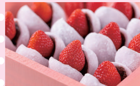
いちご大福6個(箱入)2,500円(税込)

いちごスイーツの夢のアトリエ。私たちは熱海をもっとカラフルに、もっとワクワクするまちにしたいと、いちごでいっぱいのお店を創りました。「BonBon」とは、フランス語で小さなかわいいお菓子のこと。「Bon」は、良いことを願うときにも使う言葉です。私たちが目指すのは、いちごを主役にしたとっておきのスイーツで、あなたの幸せな「トキ」を創ること。