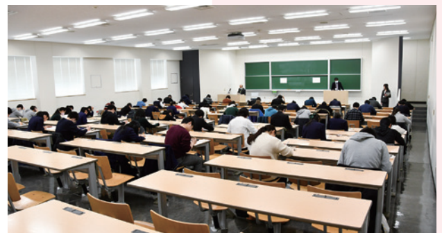
医学部一般・地域枠C（一次）試験 本学会場