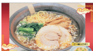
皇雅ラーメン ¥500 (しょうゆ)