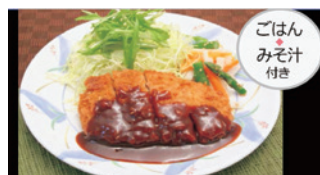
日替わりランチ(味噌カツ) ¥560