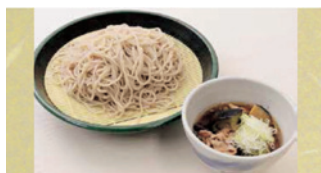
本日のそば (二八そばと豚肉、茄子のつけ汁) ¥650