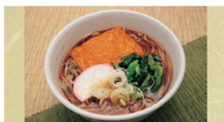
きつねそば・うどん ¥500