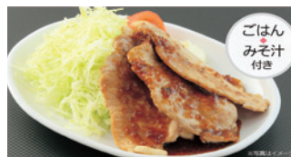
いろどり家の生姜焼き ¥700