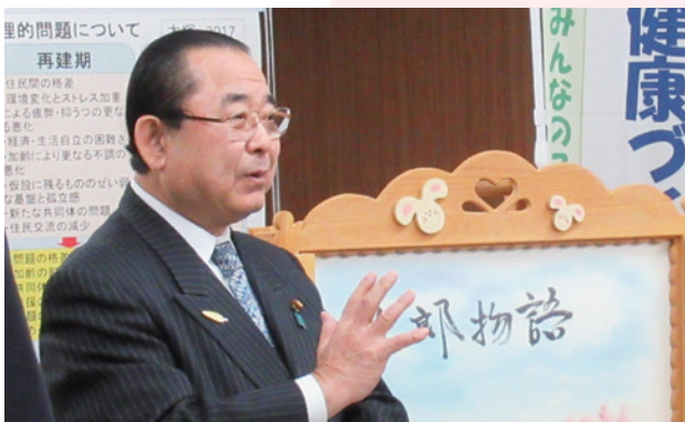
田中復興大臣 記者会見