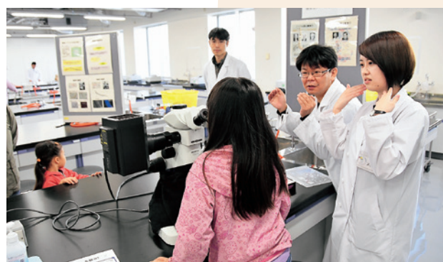
公開実験「ローリーを探せ！2019」