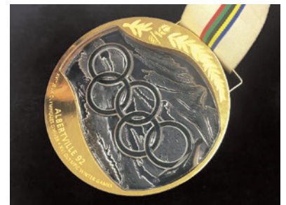
アルベールビルオリンピックの金メダル