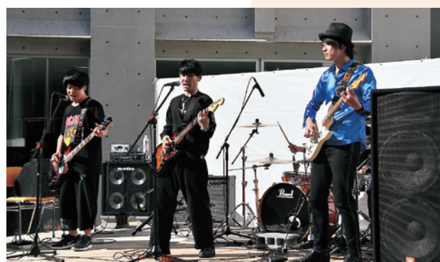
軽音楽部による演奏発表