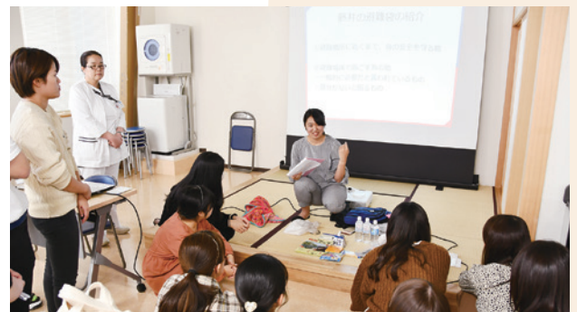
ワークショップ（10月16日開催）