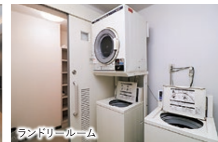
ランドリールーム