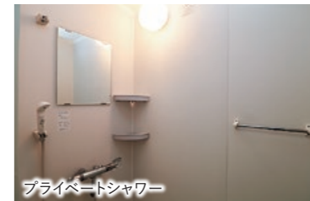
プライベートシャワー