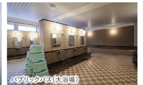
パブリックバス(大浴場)