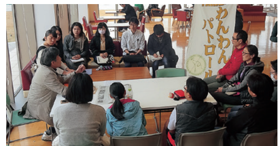
地域住民へのインタビュー