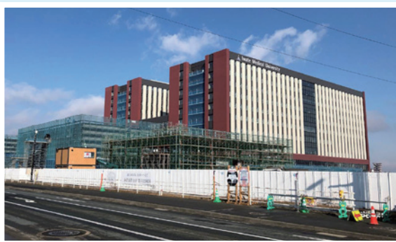
南東方向から撮影

【岩手医科大学附属病院 移転計画ブログ】 https://iten-iwate-med.blogspot.com/