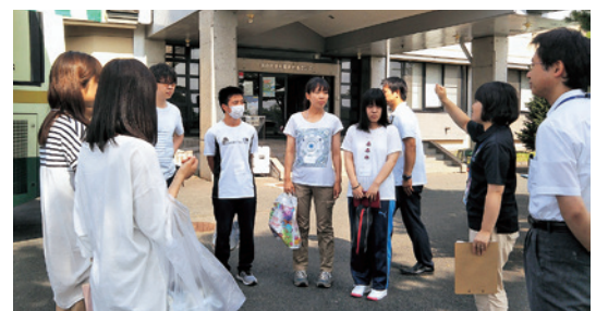
健診会場での調査