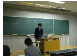
リーダーの発表の様子

今年度、プロジェクトのリーダーを経験した学生が、心がけたこと、工夫したことや悩んだこと、取り組んだ結果などを発表し、出席した学生メンバーや先生方とディスカッションしました。