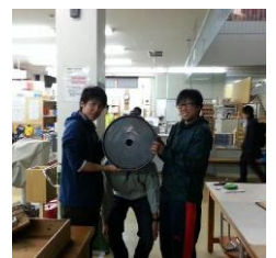
カーボンホイール製作 (エコラン)