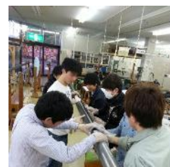
カーボンパイプ製作 (人力飛行機)