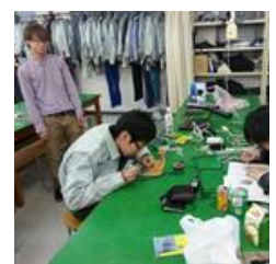
電子回路の組立て (メカニカルサポート)