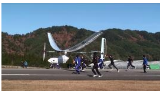
飛騨エアパーク(岐阜県)での試験飛行