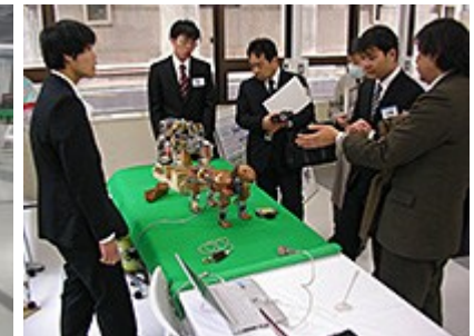
ポスターセッションの様子