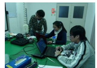
夢考房で勉強する留学生