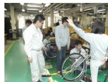
自転車の後輪外しとパンク修理