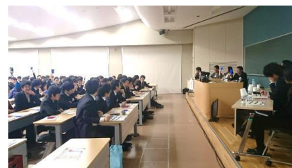
パネルディスカッションの様子