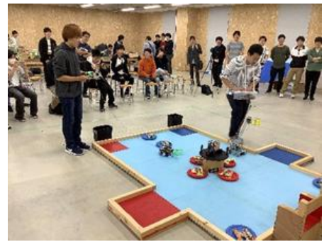
ロボット競技会の様子