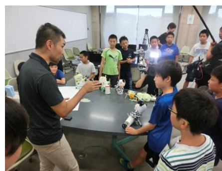
「おもちゃハック」の様子