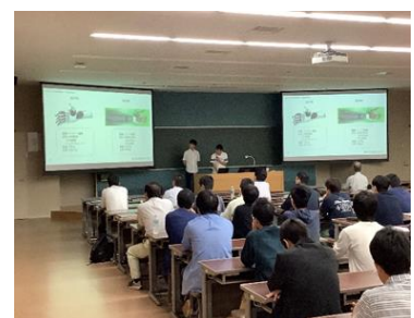
中間報告会の様子