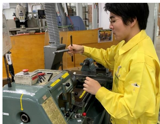
「工作機械実習」の様子