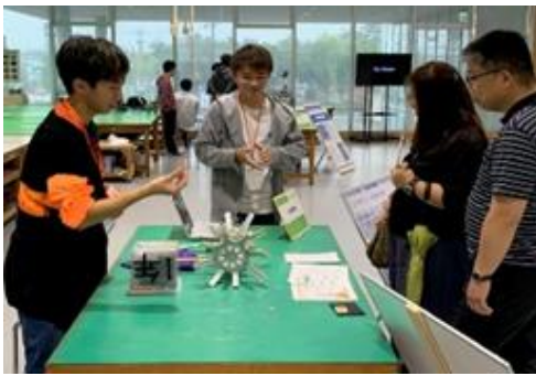
プロジェクト展示の様子

初日は悪天候でしたが、二日目は晴天となり、たくさんの人に夢考房までご来場いただきクイズラリーやプロジェクト展示を楽しんでもらうことができました。