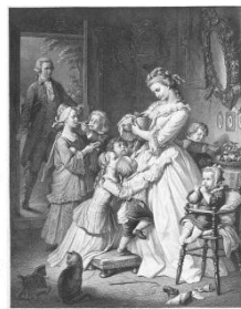
社名の由来である “若きウェルテルの悩み”のヒロイン 「シャルロッテ」