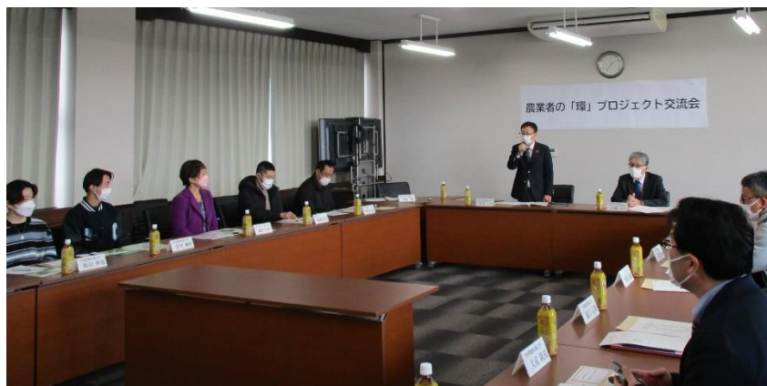
農業者の「環」プロジェクト交流会の様子

今回、本年度意見交換を行った農業者7名とZ世代である今治明德短期大学の学生4名、教職員3名に集まっていたいただき、交流会を開催することができました。