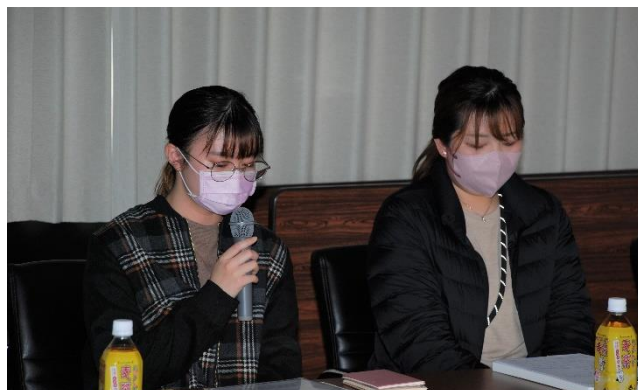
発言する今治明德短期大学の学生

今後も地域の農業者から「環」を広げ、中長期的な観点に立った多様な経営体との意見交換により、幅広い意見を汲み上げつつ、地域の課題解決につなげていきたいと考えています。