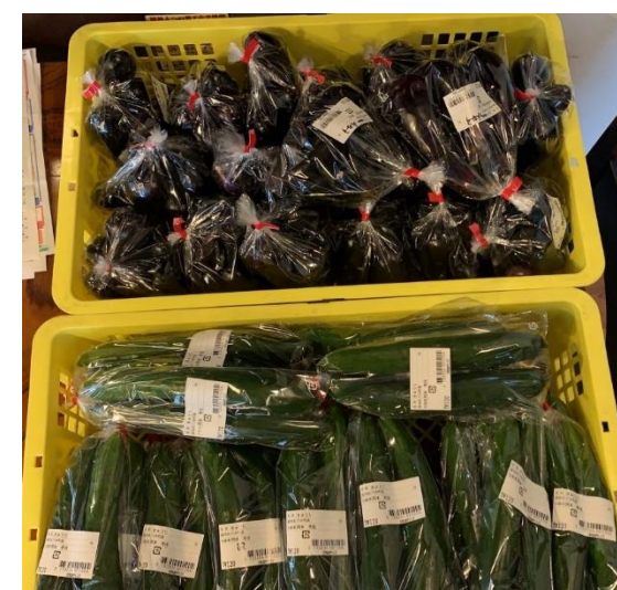
袋詰めして店頭へ