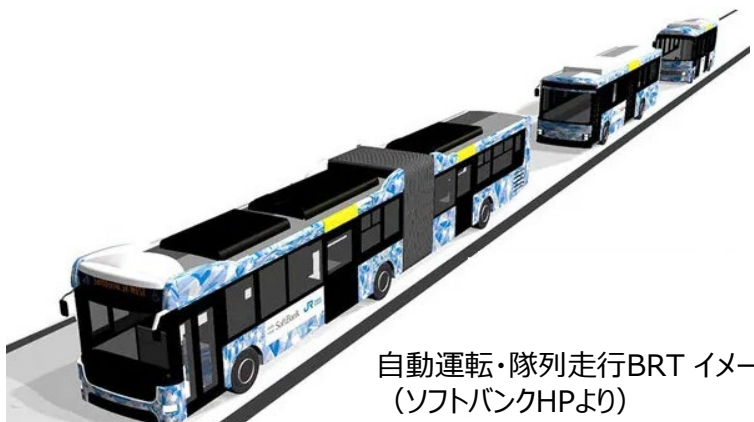
自動運転・隊列走行BRT イメージ