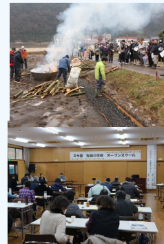
スサ農有機の学校 オープンスクール