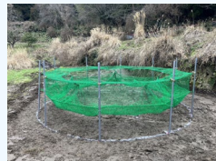
遠隔監視が可能な囲い罠