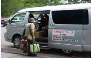
コミュニティバスの運行