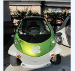
超小型モビリティ

＜三重広域連携スーパーシティ推進協議会＞ ・6町「多気町・大台町・明和町・度会町・大紀町・紀北町」、 企業、大学が一体となって設立