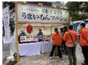
(一般消費者向けフェスにてブース出展)

福島県産水産物の 安全安心に係る情報とあわせて産地・レシピ紹介 などの魅力の発信を通じて、 消費者の購入意欲も促進 する取組を支援します。