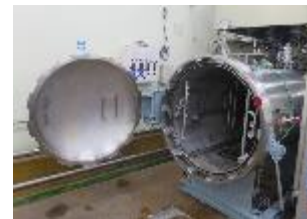
(販路回復のための水産加工機器の整備)