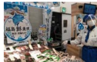
(量販店での被災地水産物の常設棚の設置)