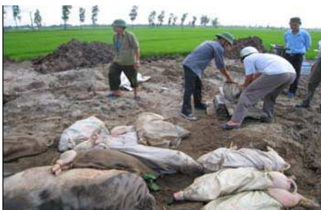
発症豚の殺処分

高病原性 PRRS は、2006 年に中国の 10 省以上に認められ、200 万頭以上が感染、40 万頭以上が死亡した 1,2) 。2007 年までに中国全土で発生が認められている 3) 。2007 年にはベトナムにおいても流行が見られ 3) 、2008 年においては 3 ヶ月間でおよそ 30 万頭の豚が失われた 4) 。また、フィリピンでもその発生が報告された 4) 。ベトナムでは、この高病原性 PRRS が 2010 年にも流行し、隣国であるカンボジア、ラオスでも発生が報告されている。我が国では、確認されていない。