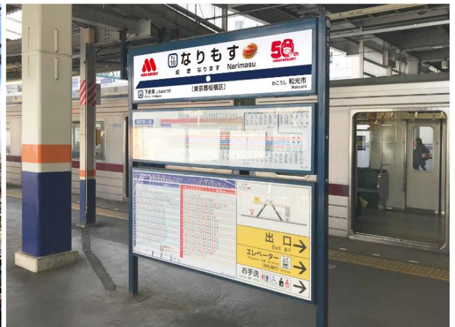
【なりもす駅看板】※画像はイメージです。