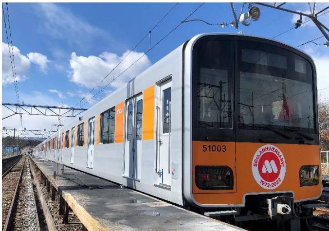
【オリジナルヘッドマークをつけた車両】

モスバーガー1号店がある東京都板橋区の東武東上線 成増駅などで東武鉄道株式会社とのコラボレーション企画を実施します。2022年3月8日（火）～4月3日（日）の期間、「成増駅」ホームと南口の駅名看板を「なりもす駅」に変更します。また東上線車両1編成の先頭部、最後尾にオリジナルヘッドマークをつけて、「なりもす駅」を含む池袋駅から小川町駅の間で運行します。更に、同車両内や池袋駅1F南口改札にも「なりもすへ行こう！」と書いたフラッグを掲出し、生まれ故郷である成増への感謝の気持ちを表現し、地域活性化を図ります。