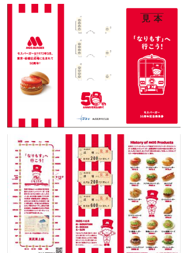
【切符台紙デザイン（表裏）】

販売駅 東武東上線 各駅窓口にて販売いたします。（合計17駅） 池袋、下板橋、大山、上板橋、成増、和光市、朝霞台、志木、ふじみ野、川越、川越市、若葉、坂戸、東松山、森林公園、小川町、武州長瀬