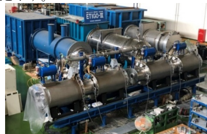
Figure 1: Experimental Apparatus "ETIGO-III".

Figure 1 に ETIGO-III の外観写真を、Fig. 2 に典型的な加速電圧とビーム電流波形を、Table 1 に ETIGO-III の設計値を示す。