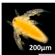
Figure 3: Artemia larvae.

本実験の照射対象としてアルテミア( Artemia Salina )の幼体を用いた。アルテミアは甲殻類に属する節足動物であり、卵の状態では直径約200 \mu\text{m} [7]、幼体では体長約500 \mu\text{m} [8]になる。アルテミアは、実際のバラスト水処理試験でも使用されており[9]、乾燥卵の状態での保存ができること、海水に投入した後約24時間で孵化すること、孵化適正温度が28 ^{\circ}\text{C} であり孵化後活動温度が0 ^{\circ}\text{C} ~38 ^{\circ}\text{C} であるため一年を通して飼育が可能なることから実験に使用しやすい。これらのことから、本研究ではアルテミアを照射対象とした。Figure 3にアルテミアの幼体の写真を示す。