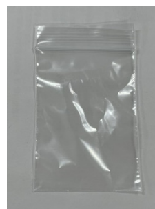
Figure 4: Irradiation container (6cm x 7cm).

ディスポカップに塩分濃度2%の人工海水を1L作製し、約200個のアルテミアの乾燥卵を投入した。その後、室温28 ^{\circ}\text{C} で28時間以上経過させ、孵化させた。この中から生存個体を50匹ずつ合計100匹取り出し、それぞれFig. 4に示す照射容器に人工海水30gと共に封入した。その後、このうちの片方にPIREBの照射を行い、照射の有無による影響を測定した。照射容器には人工海水が封入されている全範囲にCTAフィルム線量計を張り付け、照射線量の測定を行った。また、同様の実験は合計6回行い、それぞれの照射を行った集団を集団1から集団6とした。