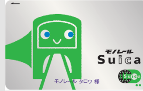
モノレール My Suica