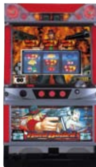
『パチスロハードボイルド』 © Sammy