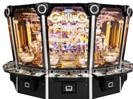
『ガリレオファクトリー』 © SEGA

以上の結果、売上高は713億30百万円(前期比21.8%減)、営業損失は75億20百万円(前期は営業損失98億7百万円)となりました。