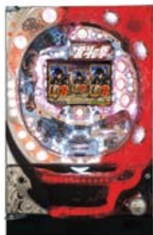
『ぱちんこCR北斗の拳』 © 武論尊・原哲夫/NSP 1983, © NSP 2007 版権許諾証SAE-307 © Sammy

パチスロ遊技機事業におきましては、「技術上の規格解釈基準」の一部改正を反映させてゲーム性を高めた、サミーブランド『パチスロハードボイルド』や『パチスロ「快盗天使ツインエンジェル2」』、ロデオブランド『回胴黙示録カイジ2』などを発売し、市場から一定の評価を得た一方で、ゲーム性向上を目的に当期の主力タイトルの発売を来期に延期したことにより、パチスロ遊技機全体で123千台の販売にとどまりました。