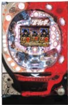
『ぱちんこCR北斗の拳 ケンシロウバージョン』 © 武論尊・原哲夫/NSP 1983, © NSP 2007 版權許諾証SAE-307 © Sammy