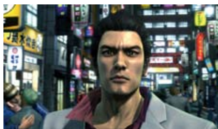
『龍が如く 3』 © SEGA