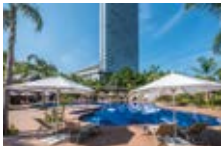
「THE LIVING GARDEN」

「シェラトン・グランデ・オーシャンリゾート」に隣接するガーデンエリアが、“大人を愉しむ水辺のリビング”をテーマに「THE LIVING GARDEN」としてリニューアルオープンしました。ガーデンプールの周辺に居心地の良いソファ席や、貸切りタイプの「ガゼボ」を配置。黒松に囲まれたエリアには、焚火を囲んでゆったり寛げる「焚火のリビング」や、ガーデンエリアを一望するガラス張りのバー「KUROBAR」など、特別なリゾート時間をお過ごしいただける空間が誕生しました。