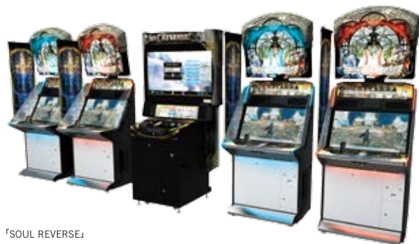
「SOUL REVERSE」 ©SEGA

今冬、セガが贈る超大作ファンタジー「ソウルリバース」シリーズに、アーケード版『SOUL REVERSE』が登場。最大10人vs10人のネットワーク対戦アクションゲームで、爽快かつ迫力のバトルが味わえます。アーケードゲーム史上最高のクオリティで緻密に描き出されたファンタジーの世界観は、幅広いプレイヤーを虜にします。