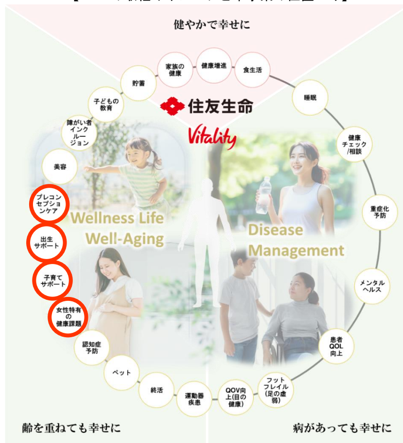
【WaaS の取組みイメージと本事業の位置づけ】

※3 Vitality 健康プログラムを中心とするウェルビーイングに資するサービスエコシステムのことです。