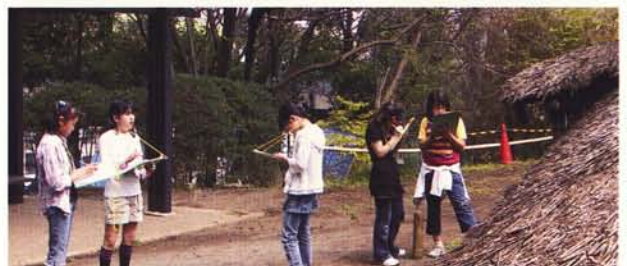
住居の入り口が狭いのは・・・なるほど!