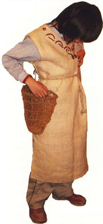
麻の服は、ちょっとチクチク・・・

遺跡庭園「縄文の村」には、復元住居(口絵)3棟をはじめ、縄文人が利用していたと考えられる