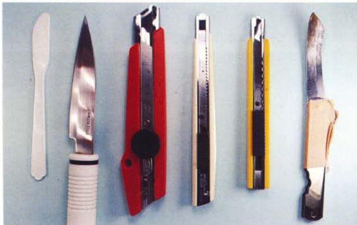
現代の「ナイフ」の数々 (果物ナイフ、カッターなどいろいろなものがある)