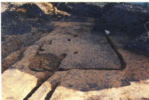
古墳時代の住居跡