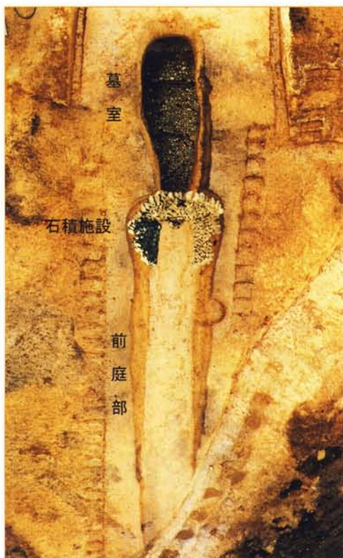
1号横穴墓全景（空撮）

墓室に通じる通路状の平坦部分（前庭部）は、多少先端が削られていたものの、長さが約19mもあり、全国でも最大級の規模をほこります。入口部には、前庭部の奥壁全面から両側壁の、長さ4.2m・幅3.8m・高さ3.1mの範囲にかけて石が積まれており、一点一点数えたところ、総数で945点、総重量約5.2tにも達しました。また羨門には柱状の切石が組まれ、さらに扉はしっかりと塞がれたままの状態であったことから、盗掘にあっていないこともわかりました。