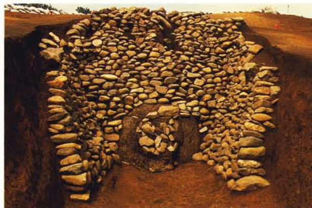
1号横穴墓石積施設全景

前庭部からは、墓前祭祀に使われたと思われる、静岡県・湖西窯産須恵器の大甕とフラスコ形（瓶）が、さらに追加の埋葬（追葬）の際に墓室から掻き出され