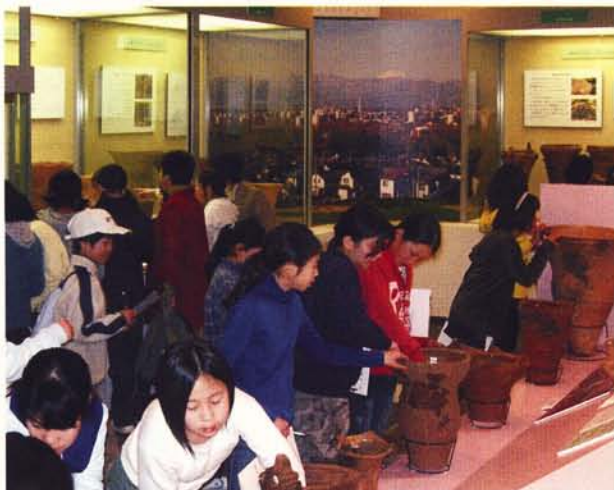
土器の中って、けっこうツルツルしてるね！

時 間に余裕のある学校は、まず会議室で、多摩丘陵に暮らした数千年前の人々のくらしぶりを 15 分ほどにまとめた映画「縄文人のくらし」を