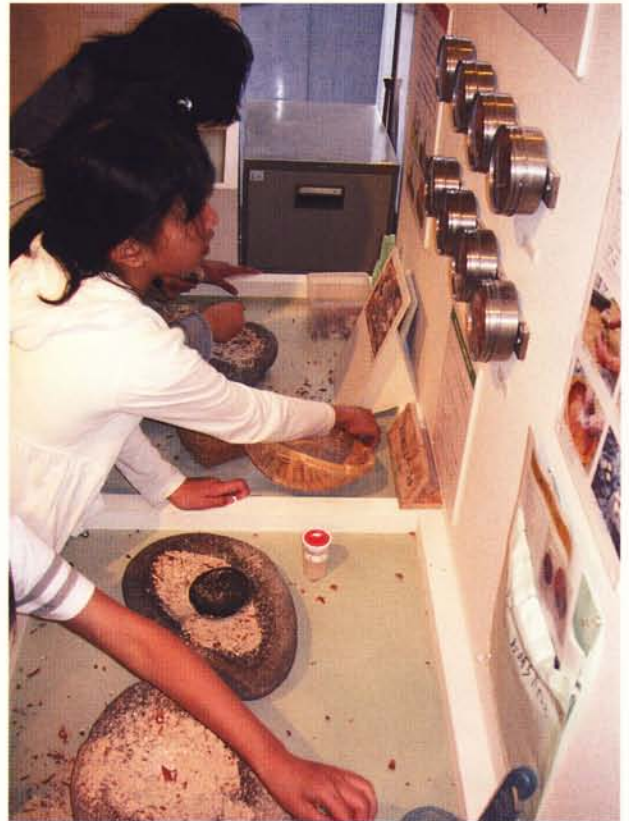
石皿って、こんなにきれいな粉ができるんだ！

ご覧いただけます。また同映画については、DVD の貸し出しも行っておりますので、事前もしくは事後の学習に活用していただくこともできます。