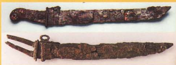
蕨手刀の形式 (上が古く、下が新しい)

さらに、蕨手刀の大きな特徴は、異文化を持つ集団間において、墳墓の副葬品として採用されたことです。つまり、本州の倭の領域では石室墳や横穴墓 よこあなぼ 、東北北部～