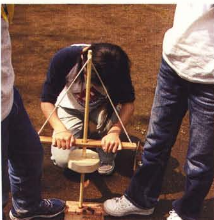
火おこして、けっこう重労働!

し体験についても、より多くのご希望にそえる体制を整えております。火をおこすことの大変さを通して、火の恩恵や火を扱う上での心構え、グループで協力することの大切さなどを体感していただけたらと思っていますが、真剣に取り組む生徒さんの