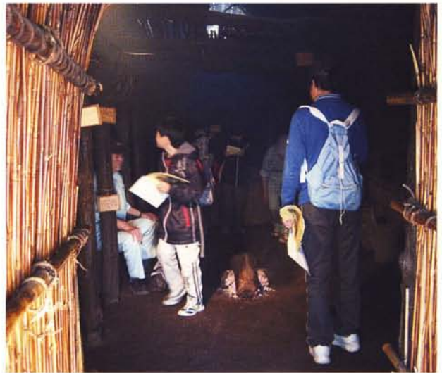
けむい、くさい、くらい!でも、なぜか落ち着く住居の中。

す。緑豊かな庭園での昼食は、給食とは一味違った楽しいひとときになっています。当日雨が降った場合でも、会議室が利用可能ですのでご安心下さい。