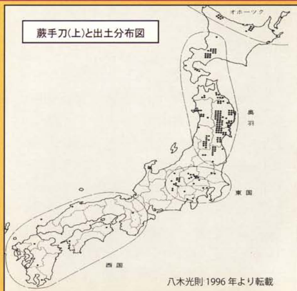
八木光則 1996 年より転載

道南部では末期古墳や北海道式古墳、道東～道北部ではオホーツク文化期の土壌墓 どこうぼ などから見つかります。このことは、埋葬習俗とは関係無く、この刀が倭人社会から広く蝦夷や北方民族への交易品として流通し、族長層により宝器(ニイコロ)として受容されたと考えられます。本格的な鍛冶技術 かじ を持たなかった北の異民族にとって、「蕨手刀」には何か特別な霊力が宿ると信じられていたのかもしれない。(松崎)