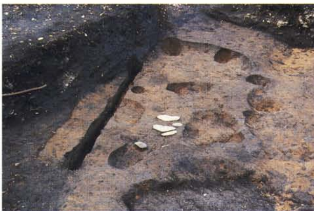
縄文時代の住居跡

遺跡の状態はあまり良い状態とはいえませんが、縄文時代から中近世まで、いろいろな時代の痕跡を見つけることができました。（岩橋）