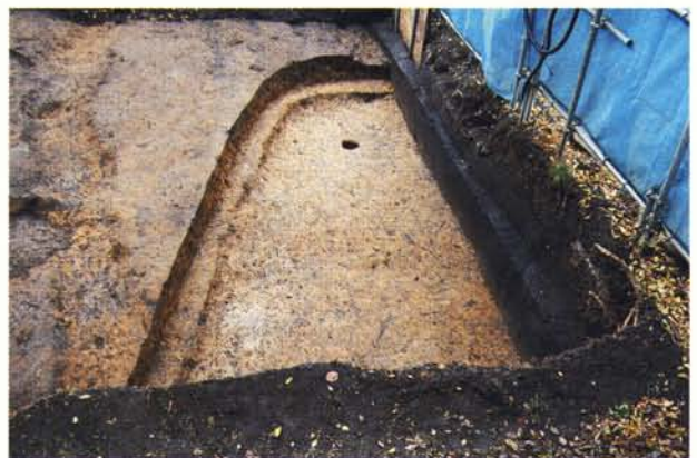
弥生時代の住居跡