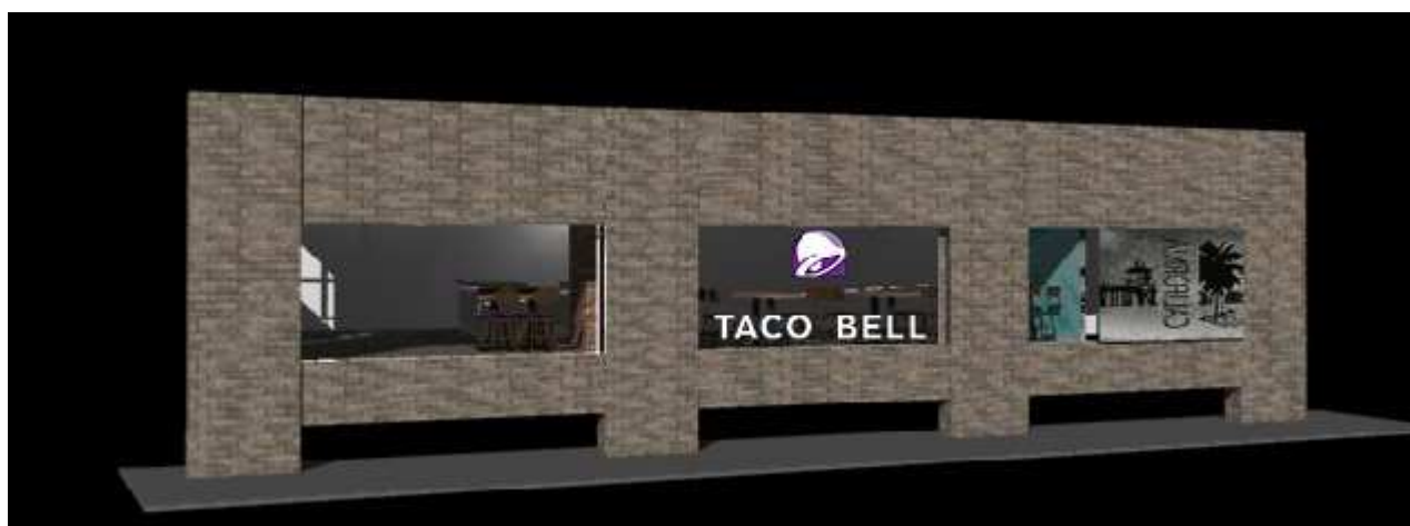
店頭外観イメージ

株式会社 JFLA ホールディングス(本社:東京都中央区/代表取締役社長:檜垣 周作)の子会社である株式会社 TB ジャパン(本社:東京都中央区/代表取締役社長:檜垣 周作)は、全米を中心に世界で 7,000 店舗以上を展開するアメリカ発のメキシカン・ファストフード「TACO BELL(タコベル)」大阪 2 号店となる阪急三番街店を、2019年1月29日(火)オープン致します。